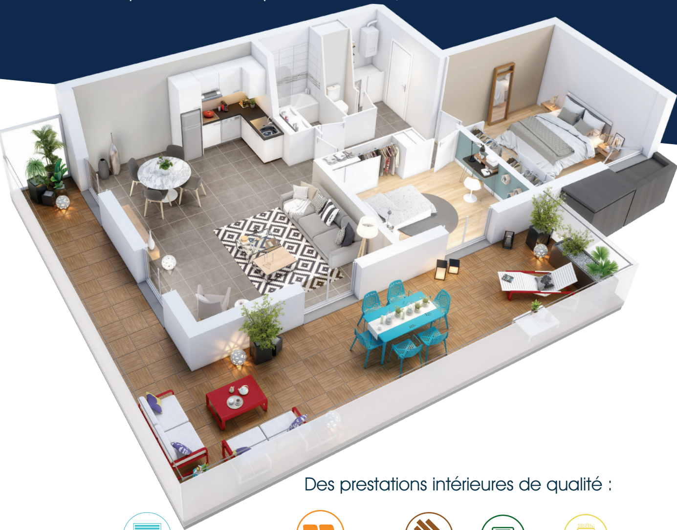
Des prestations intérieures de qualité :

« qu’il est bon de profiter de son jardin les soirs d’été ».